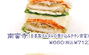
南響寺(自家製タルタルの漬け込みチキン南蛮) ¥660(税込¥712)