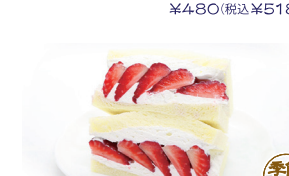
平安(いちご) 季節限定 ¥500(税込¥540)