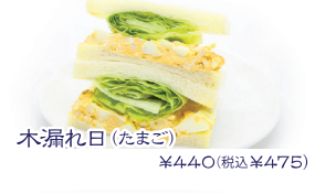
木漏れ日(たまご) ¥440(税込¥475)