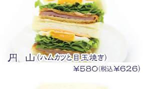
円山(ラムカツと目玉焼き) ¥580(税込¥626)