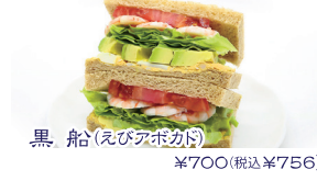
黒船(えびアボカド) ¥700(税込¥756)