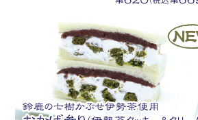
鈴鹿の七樹かぶせ伊勢茶使用 おがび参り(伊勢茶クッキー&クリーム) NEW ¥480(税込¥518)