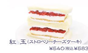
紅玉(ストロベリーチーズケーキ) ¥540(税込¥583)