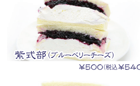
紫式部(ブルーベリーチーズ) ¥500(税込¥540)