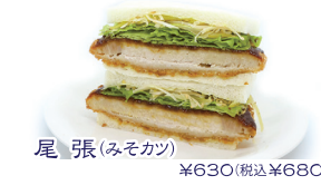
尾張(みそカツ) ¥630(税込¥680)