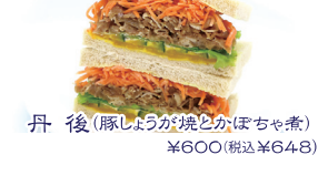
丹後(豚しょうが焼とかぼちゃ煮) ¥600(税込¥648)