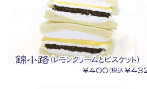
錦小路(レモンクリームとビスケット) ¥400(税込¥432)