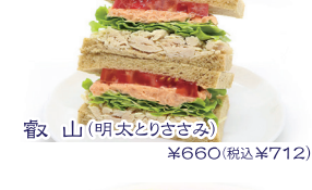
響山(明太とりささみ) ¥660(税込¥712)