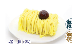
名月(栗) 数量限定 季節限定 ¥620(税込¥669)