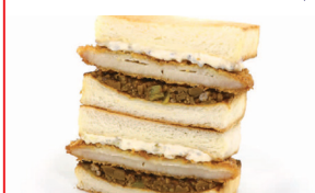
北大路(キーマカツカレー) ¥800(税込¥864)