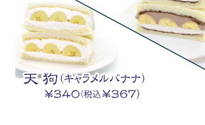
天狗(キャラメルバナナ) ¥340(税込¥367)