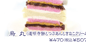
烏丸(道明寺餅とつぶあんときなこクリーム) ¥470(税込¥507)