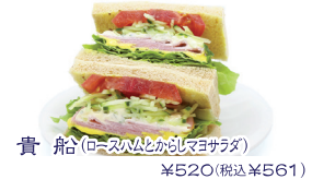
貴船(ロースカツとかにメヨサラダ) ¥520(税込¥561)