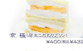
京極(店主こだわりのプリン) ¥400(税込¥432)