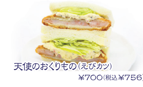
天使のおくりもの(えびカツ) ¥700(税込¥756)