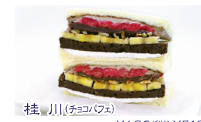
桂川(チョコバナナ) ¥480(税込¥518)