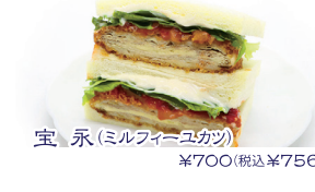
宝永(ミルフィーユカツ) ¥700(税込¥756)