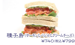
種子島(サーモンバジルとクリームチーズ) ¥740(税込¥799)