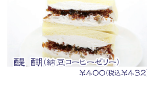
醍醐(納豆コーヒージェリー) ¥400(税込¥432)