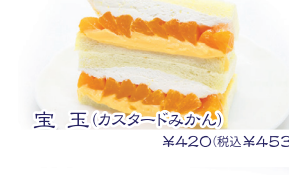
宝玉(カスタードみかん) ¥420(税込¥453)