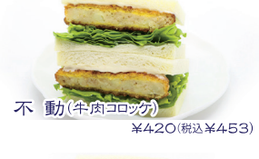
不動(牛肉コロッケ) ¥420(税込¥453)