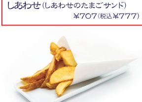
皮付きフライドポテト(天日塩) ¥400(税込¥432)