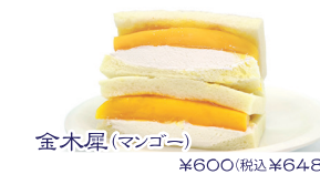
金木屋(マンゴニー) ¥600(税込¥648)