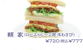
頼家(ローストビーフ西洋わさび) ¥720(税込¥777)