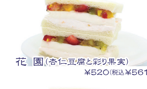
花園(杏仁豆腐と彩り果実) ¥520(税込¥561)