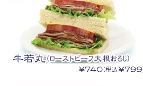
牛若丸(ローストビーフ大根おろし) ¥740(税込¥799)