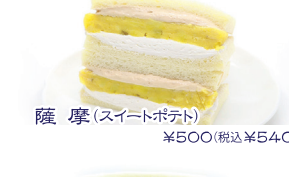
薩摩(スイートポテト) ¥500(税込¥540)