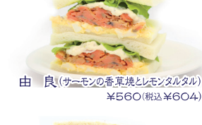
由良(サーモンの香煎焼とレモンタルタル) ¥560(税込¥604)