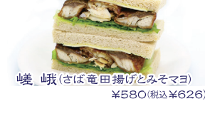
嵯峨(さば竜田揚げとみそマヨ) ¥580(税込¥626)