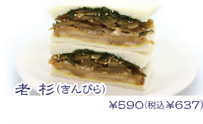
老杉(きんぴら) ¥590(税込¥637)