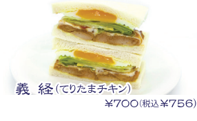
義経(てりたまチキン) ¥700(税込¥756)