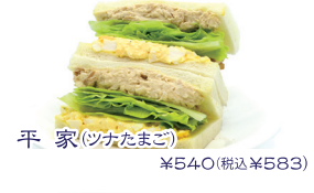
平家(ツナたまご) ¥540(税込¥583)