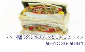
八幡(グリルチキンとじゃこピーマン) ¥640(税込¥691)