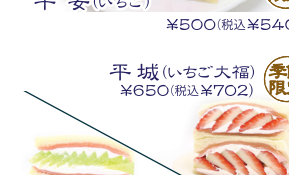
平城(いちご大福) 季節限定 ¥650(税込¥702)