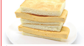
都(出汁巻き卵) ¥460(税込¥496)