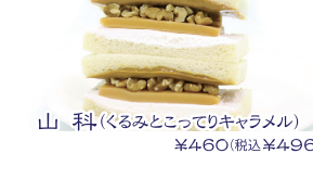
山科(ぐるみとこっぴりキャラメル) ¥460(税込¥496)