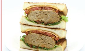
朱雀(ハンバーグ) ¥800(税込¥864)