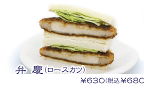
弁慶(ロースカツ) ¥630(税込¥680)