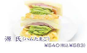
源氏(ラムたまご) ¥540(税込¥583)