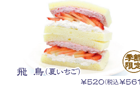
飛鳥(夏いちご) 季節限定 ¥520(税込¥561)