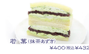
若葉(抹茶あずき) ¥400(税込¥432)