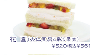
花園(杏仁豆腐と彩り果実) ¥520(税込¥561)