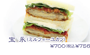
宝永(ミルフィーユカツ) ¥700(税込¥756)