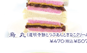
烏丸(道明寺餅とつぶあんときなこクリーム) ¥470(税込¥507)