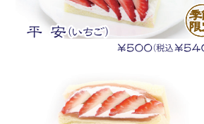
平城(いちご大福) ¥650(税込¥702)