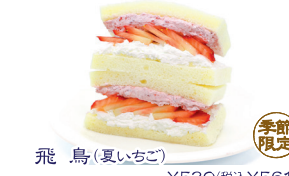
飛鳥(夏いちご) ¥520(税込¥561)