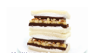
桂川(チョコバナ) ¥480(税込¥518)