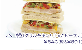
八幡(グリルチキンとじゃこピーマン) ¥640(税込¥691)