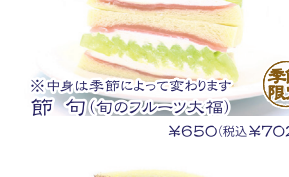
平城(いちご大福) ¥650(税込¥702)