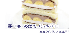
芽映-めばえ-(チョコバナナ) ¥420(税込¥453)