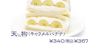
天狗(キャラメルバナナ) ¥340(税込¥367)