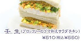
壬生(ブロッコリーのゴマ和えサラダチキン) ¥510(税込¥550)