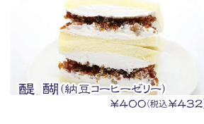
醍醐(納豆コーヒゼリー) ¥400(税込¥432)