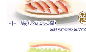
平城(いちご大福) ¥650(税込¥702)