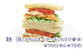
鉄浜(かねはま) (サーモンわさび醤油) ¥700(税込¥756)