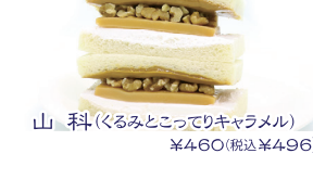
山科(くるみとこってりキャラメル) ¥460(税込¥496)