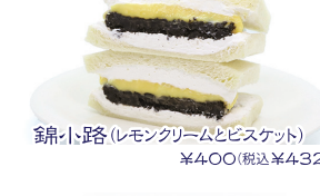
錦小路(レモンクリームとビスケット) ¥400(税込¥432)