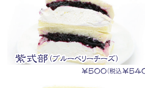
紫式部(ブルーベリーチーズ) ¥500(税込¥540)